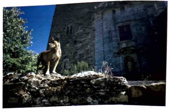
Monasterio San Pedro de Montes, 7de eeuw

De beste man vertelt dat het dorp leeft van hun groentetuinen tegen de hellingen en hij begrijpt, denk ik, onze verwondering niet. Tijd voor ons om verder te gaan.